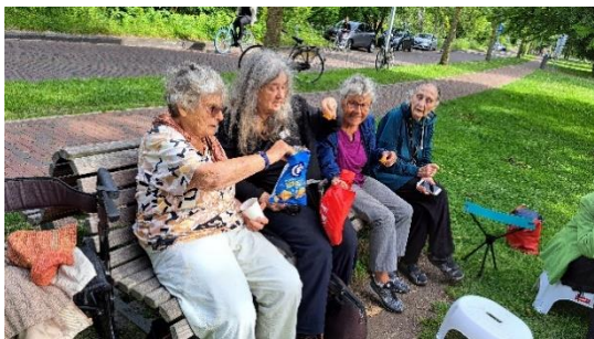
Gezellig op een bankje in het Martin Luther Kingpark tijdens de Inloop in juli