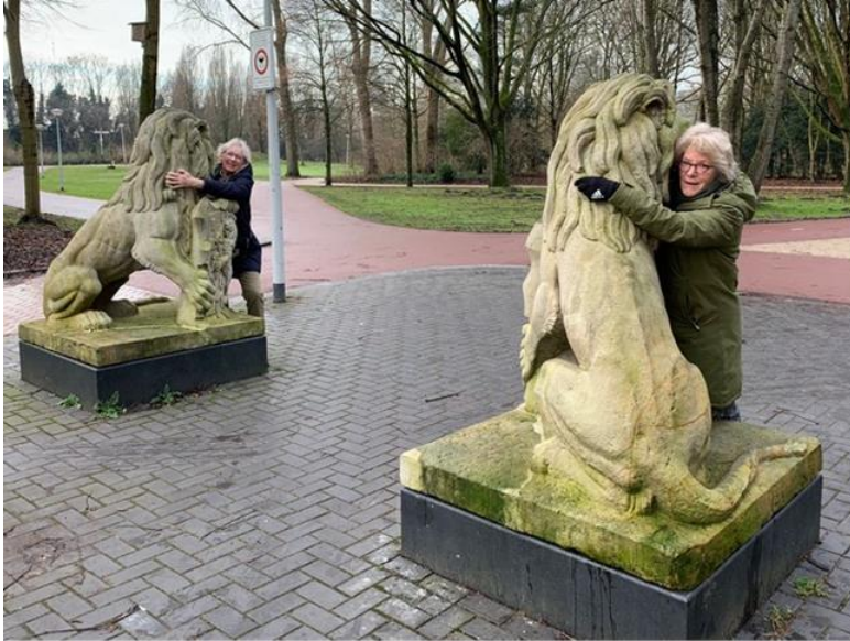
‘coronatijsd = steenkoude leeuwen knuffelen’