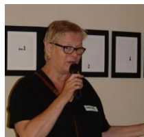
Wandelclub Minder Ver