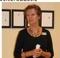
Zorg en wonen